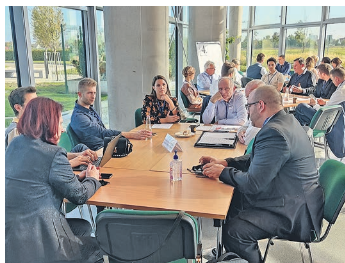
Kerekasztal-beszélgetéseken osztották meg a gondolataikat

Ahogy a szervezők már a meghívóban is foglalmazták, az Ipar 4.0-nak nevezett technológiai, technikai és bizonyos szempontból kulturális forradalom gyors-